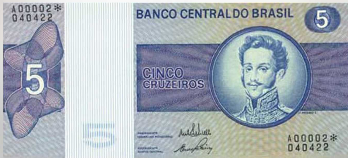
Acima a nota de Cr$ 5,00 com a efígie de Dom Pedro I, nota lançada em 1970.