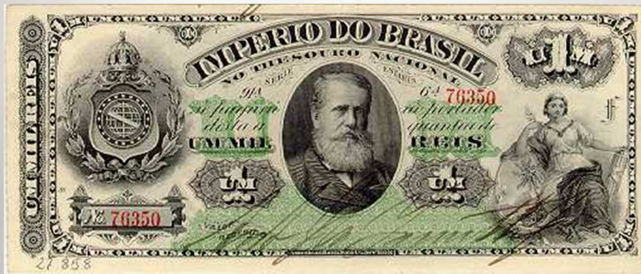
Cédula de mil réis, emitida durante o Segundo Império. Imagem em destaque de Dom Pedro II.