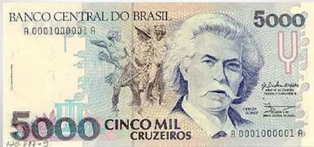
Figura do compositor Carlos Gomes (1836-1896), com detalhes de três figuras que representam "O Guarani", "Salvador Rosa" e "O Escravo", três de suas mais importantes óperas. A cédula de Cr$ 5.000 (cinco mil cruzeiros) ficou em circulação de 1990 a 1994.