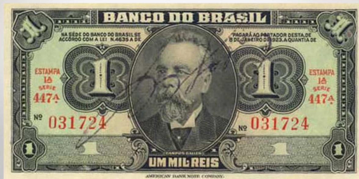
Nota de Um Mil Réis, de 1923. A efígie da cédula é de Campos Salles.