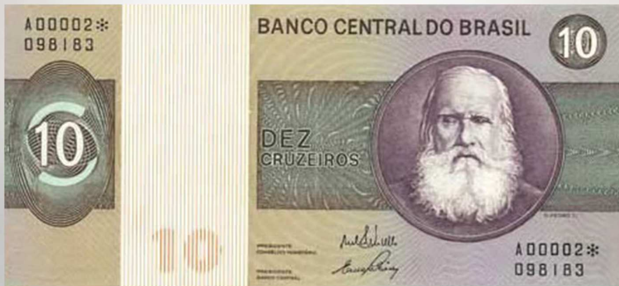
Acima a nota de Cr$ 10,00 com a efigie de Dom Pedro II, nota lançada em 1970.