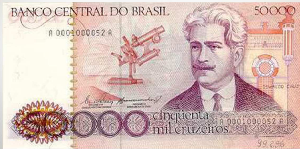
Figura do sanitaria brasileiro Oswaldo Cruz (1872-1917), pioneiro no estudo das moléstias tropicais no Brasil. A cédula de Cr$ 50.000 (cinquenta mil cruzeiros) ficou em circulação de 1984 a 1990.