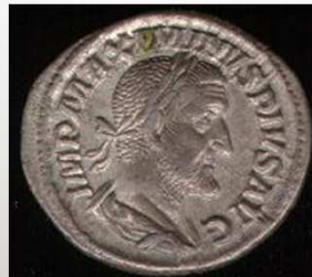
Ao lado, um Denário (Roma, 211 a.C.) e uma Drácula (Lucânia, Grécia, 535 a.C.).

Moedas e cédulas são importantes fontes históricas, pois possibilitam ao historiador compreender mais sobre a forma de governo, a língua, a religião, os governantes e a situação econômica do país que emitiu a moeda. Cada vez mais a numismática tem sido utilizada nas pesquisas de povos e nações do passado.